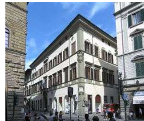
Palazzo Panciatichi sede del Consiglio regionale della Toscana